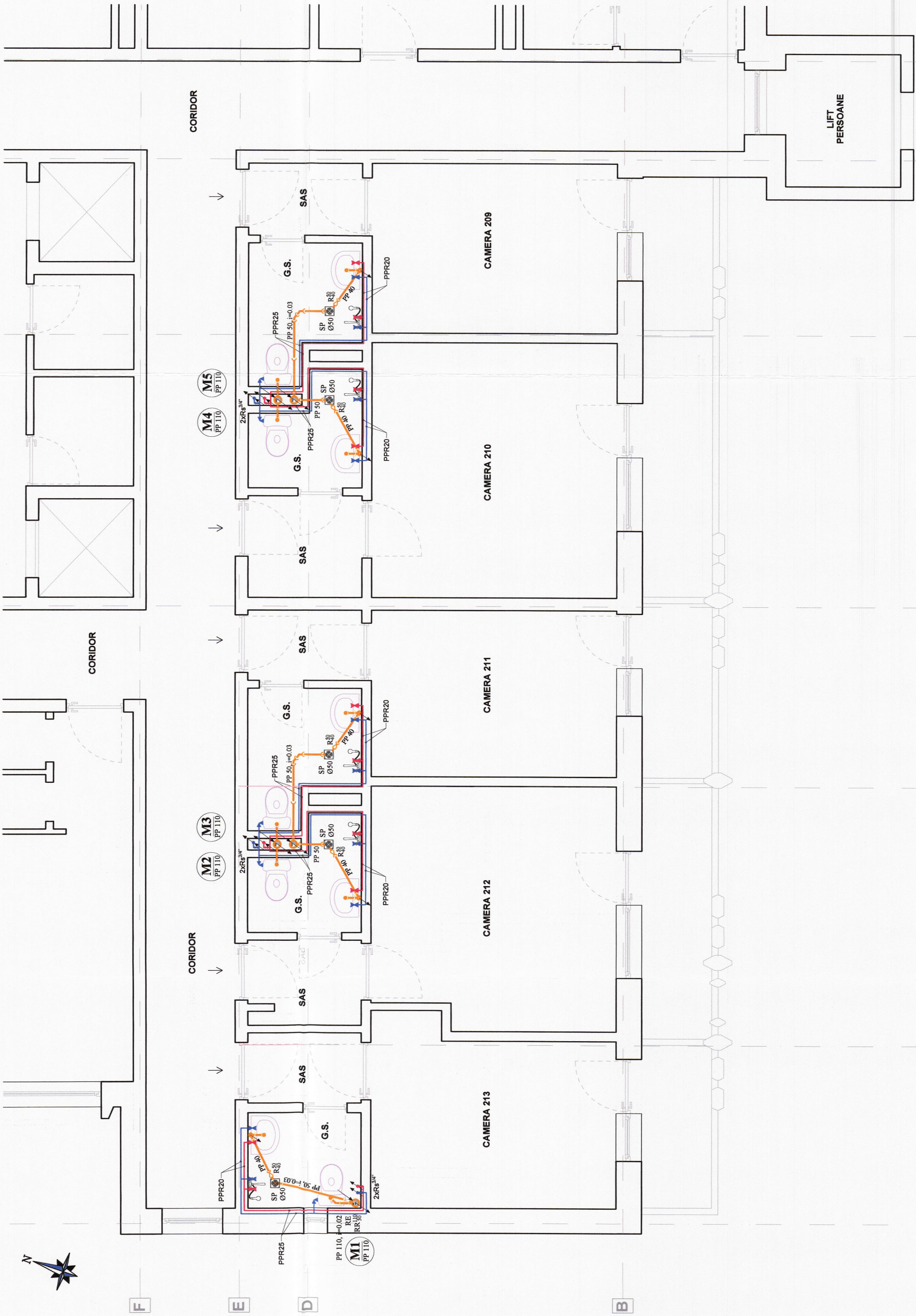
- PLAN ETAJ 2 -